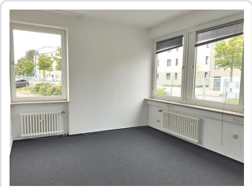
Raum 2 Bild 2.jpg