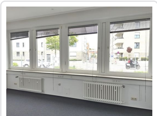
Raum 2 Bild 1.jpg