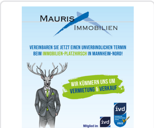
Wir kümmern uns um Vermietung und Verkauf