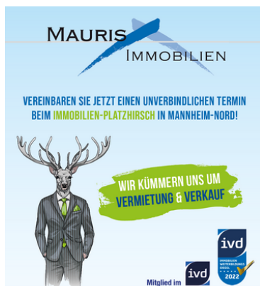
Wir kümmern uns um Vermietung und Verkauf