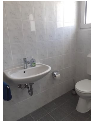
Bad Bild 1.jpg