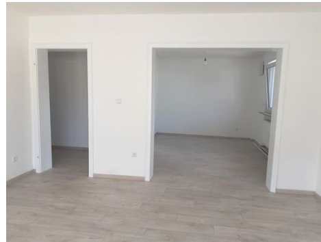
Wohnen - Essen.jpg