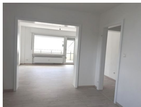
Essen - Wohnen.jpg