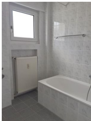
Bad Bild 2.jpg