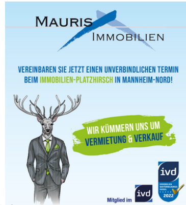
Wir kümmern uns um Vermietung und Verkauf