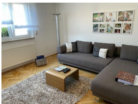
Wohnen 1. OG