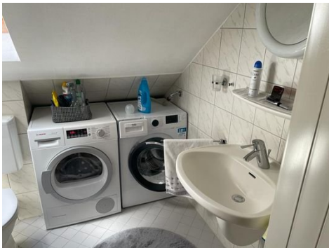
Bad Bild 1 DG