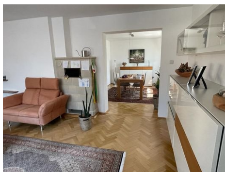
Wohnen-Essen 1. OG