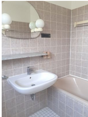
Bad Bild 1