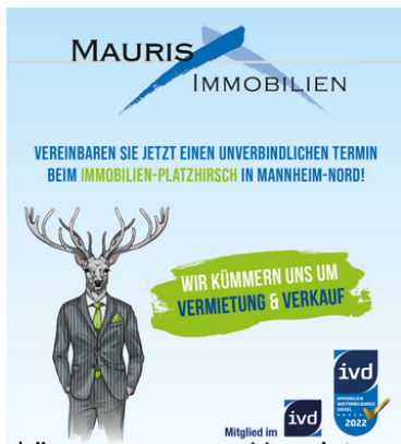
Wir kümmern uns um Vermietung und Verkauf