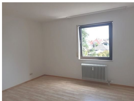
Schlafen Bild 2