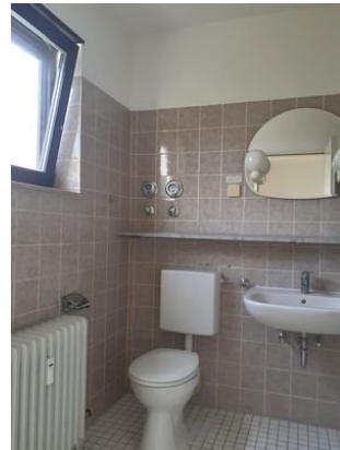
Bad Bild 2