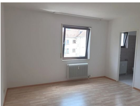
Schlafen Bild 1