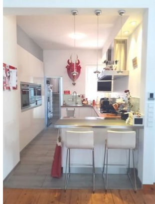
Küche Bild 1