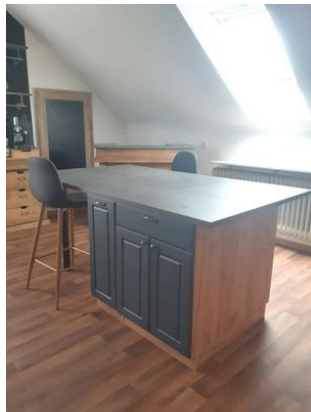
Küche Bild 3