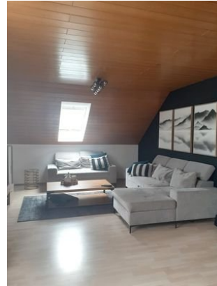
Wohnen-Essen Bild 1