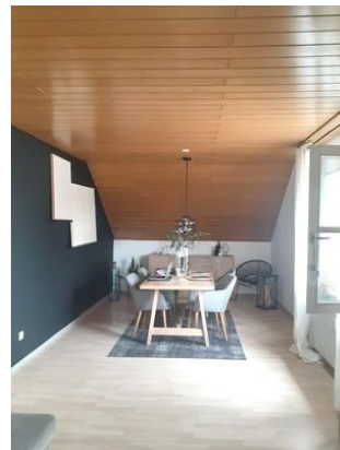
Wohnen-Essen Bild 2