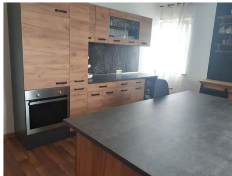
Küche Bild 2