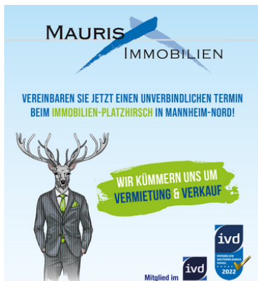
Wir kümmern uns um Vermietung und Verkauf