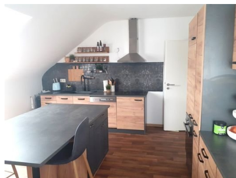
Küche Bild 1