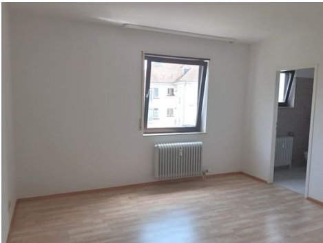
Schlafen Bild 1