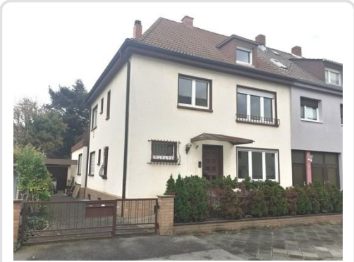
Straßenansicht Bild 1