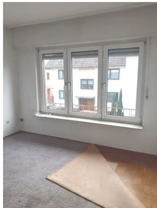
Zimmer 2 OG