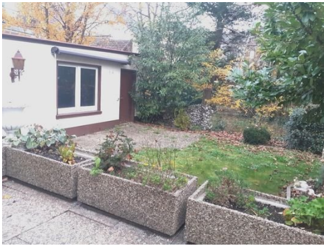
Garten Bild 2