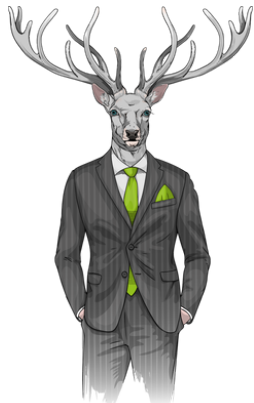
Wir kümmern uns um Vermietung und Verkauf