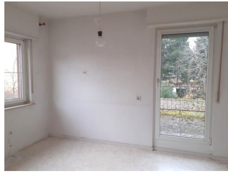
Zimmer 1 OG