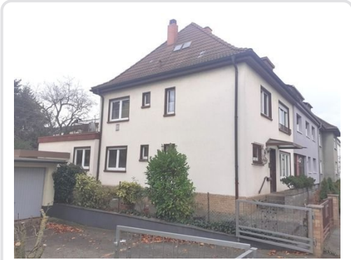
Straßenansicht Bild 2