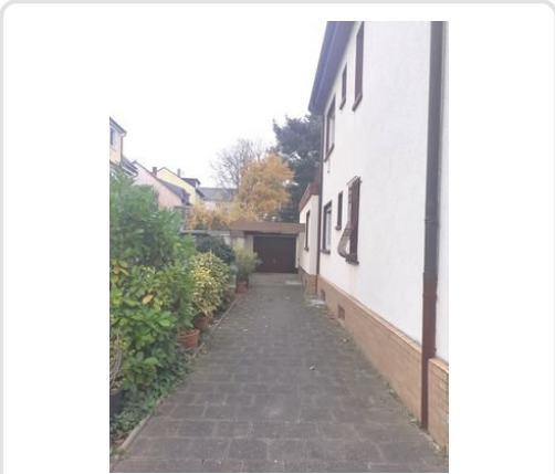
Einfahrt mit Garage.jpg