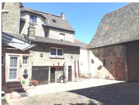
Hof mit Scheune