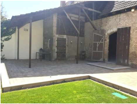
Terrasse Bild 2