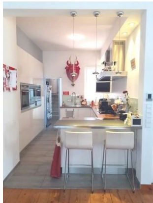
Küche Bild 1