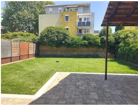
Garten Bild 1