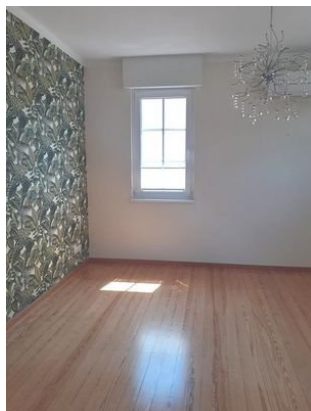
Schlafen Bild 2