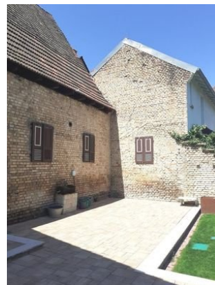
Terrasse Bild 1