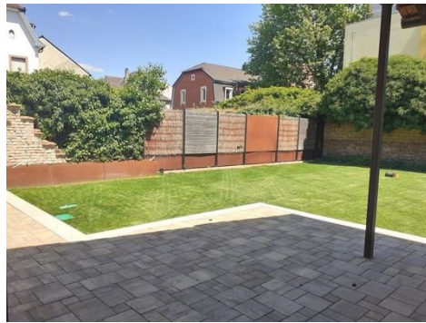
Garten Bild 2