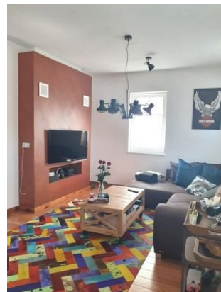
Wohnen Bild 2