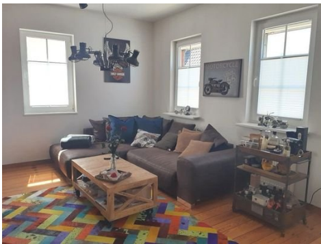
Wohnen Bild 1