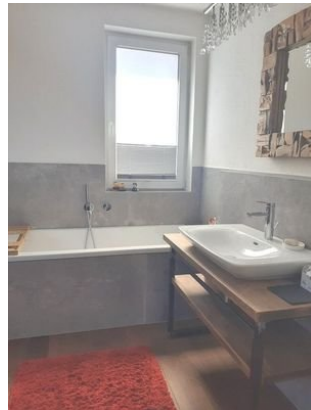
Bad Bild 1