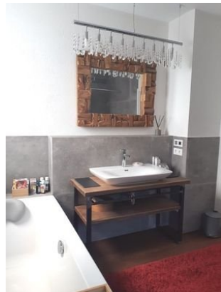
Bad Bild 3