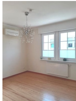
Schlafen Bild 1