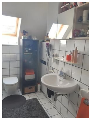
Gäste Bad DG