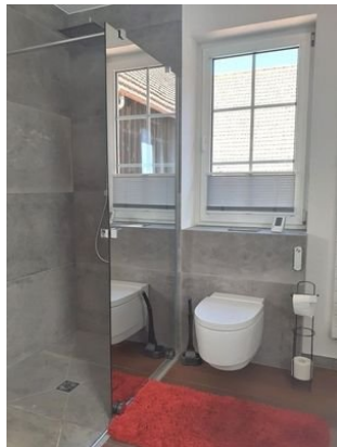
Bad Bild 2