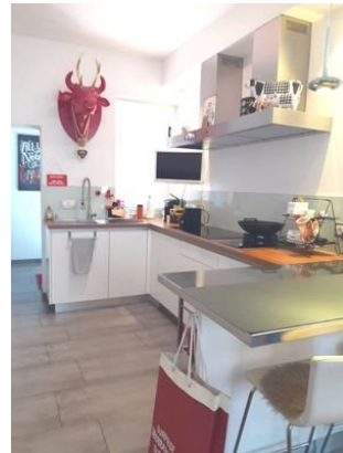
Küche Bild 2